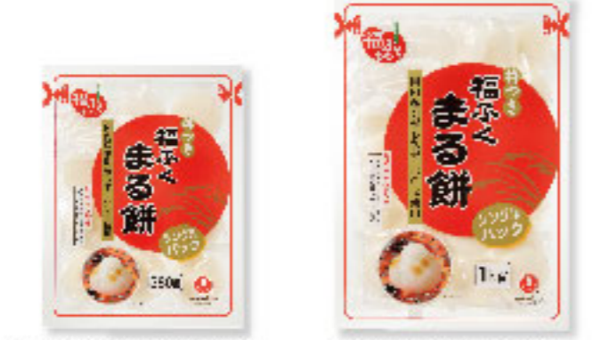
⑤福ふくまる餅 360g×20入 ⑥福ふくまる餅 1kg×10入

国内産水稲もち米を100%使用したまる餅です。 調理の用途に合わせてご利用いただけます。