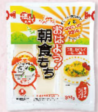
⑮おはよう!朝食もち 320g×10入×28 ★要注生庫

餅の厚さを薄くして 熱効率を良くしました 新潟県産水稲もち米を 100%使用。忙しい朝や ちょっとした夜食にも手 早く調理いただけます。