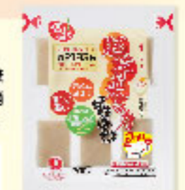
㉓胚芽米の方もち 300g×10入×28 ★要注生庫

玄米の優れた栄養成分と白米の食べやすさを兼ね 備えた胚芽米を「もち」にすることで、さらに消 化吸収が良くなります。焼くと香ばしく絶品です。