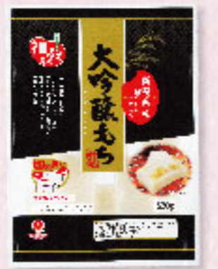
⑭大吟醸もち整列タイプ 550g×10入 ★要注生庫

美味しさを追求したお餅 それが大吟醸もちです 新潟県産水稲もち米を100% 使用。従来の精米歩合より約 2.5倍増して米を磨きあげまし た。旨みと甘みの凝縮された 部分だけを原料として使用し ています。