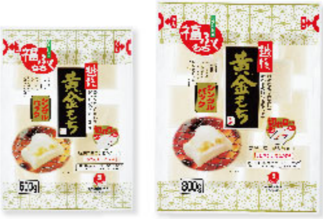
⑩黄金もち 500g×20入 ⑪黄金もち 800g×12入