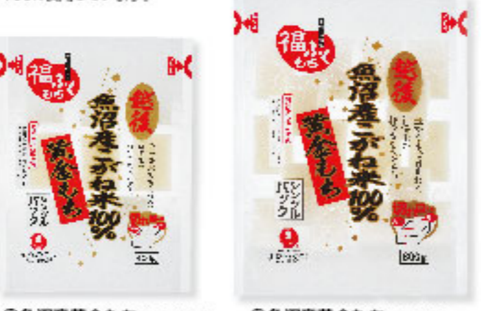
⑫魚沼産黄金もち 400g×20入 ⑬魚沼産黄金もち 800g×12入