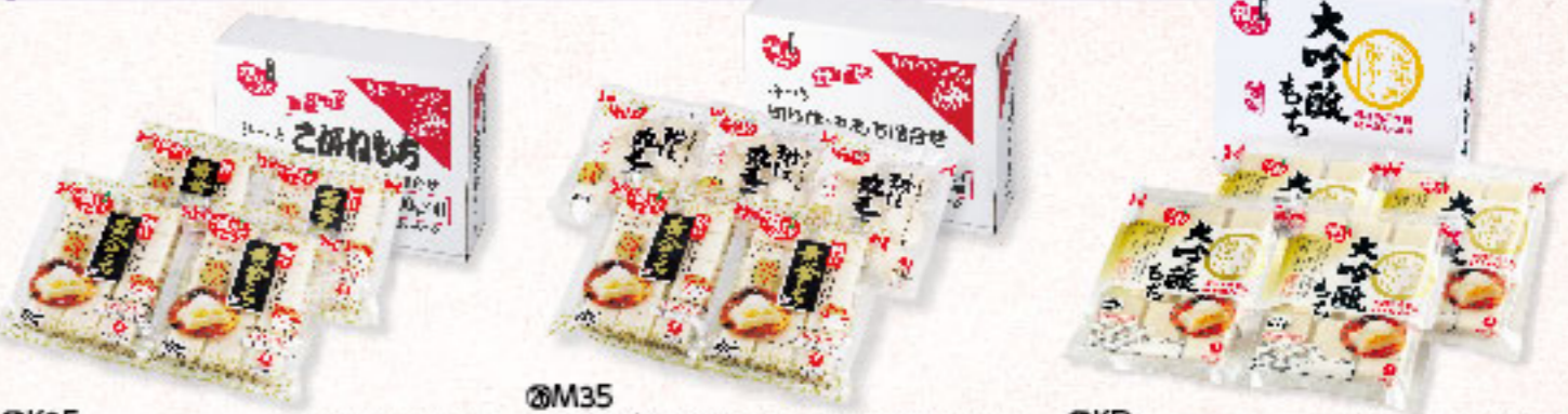
⑫K35 こがねもち合せ 黄金もち(500g×4個)×4入、 丸もち(360g×3個) ★要注生庫 新潟県産こがねもち100%使用