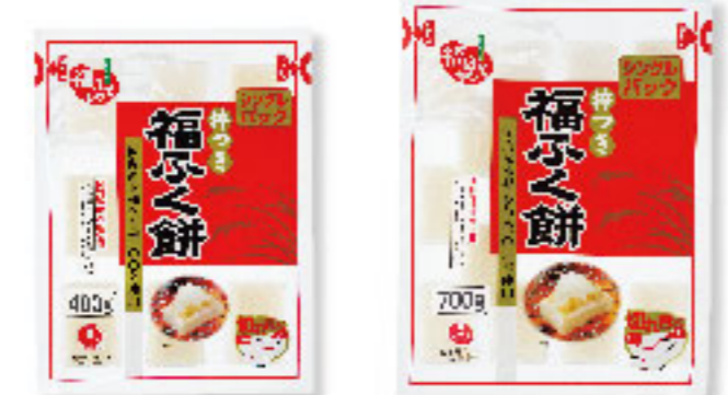
①福ふく餅 400g×20入 ②福ふく餅 700g×12入