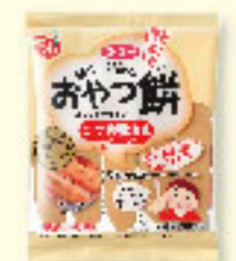
㉒おやつ餅 コク旨醤油味 100g×20入 ★要注生庫