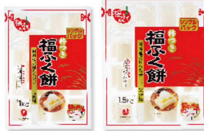
③福ふく餅 1kg×10入 ④福ふく餅 1.5kg×6入