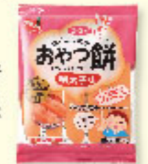
⑳おやつ餅 明太子味 100g×20入 ★要注生庫

程よい塩味と旨味。お子 様でも食べやすいように、 辛さを控えめでマイルドな 味に仕上げております。