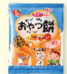
㉑おやつ餅 チーズ味 100g×20入 ★要注生庫

チeddarチーズを使用し 、コクのある濃厚な味 わいが後をひく美味し さです。