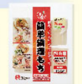
㉔簡単調理もち 150g×10入×28 ★要注生庫

もちをスティック状にすることで熱効率がよ く、通常の餅の約半分の短時間加熱でお 召し上がりいただけます。