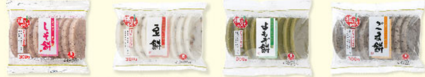
⑯生かき餅 300g×20入 ⑰生かき餅 300g×20入 ⑱生かき餅 300g×20入 ⑲生かき餅 300g×20入