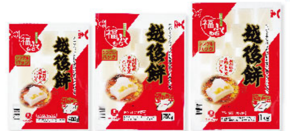
⑦越後餅 400g×20入 ⑧越後餅 750g×12入 ⑨越後餅 1kg×10入